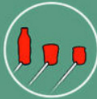
Moulage ou soufflage