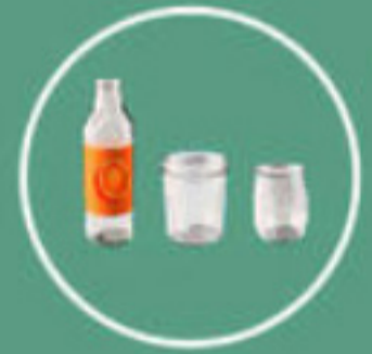
Refroidissement de l'emballage