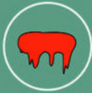
Mélange et fusion à très haute température