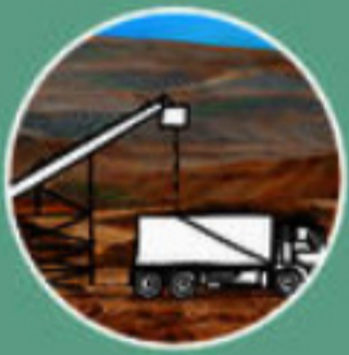
Extraction du sable